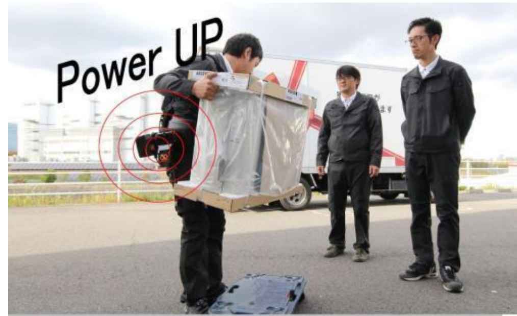
エアコンの室外機を軽々持ち上げる

https://art-tc.jp/corporate/technology.html