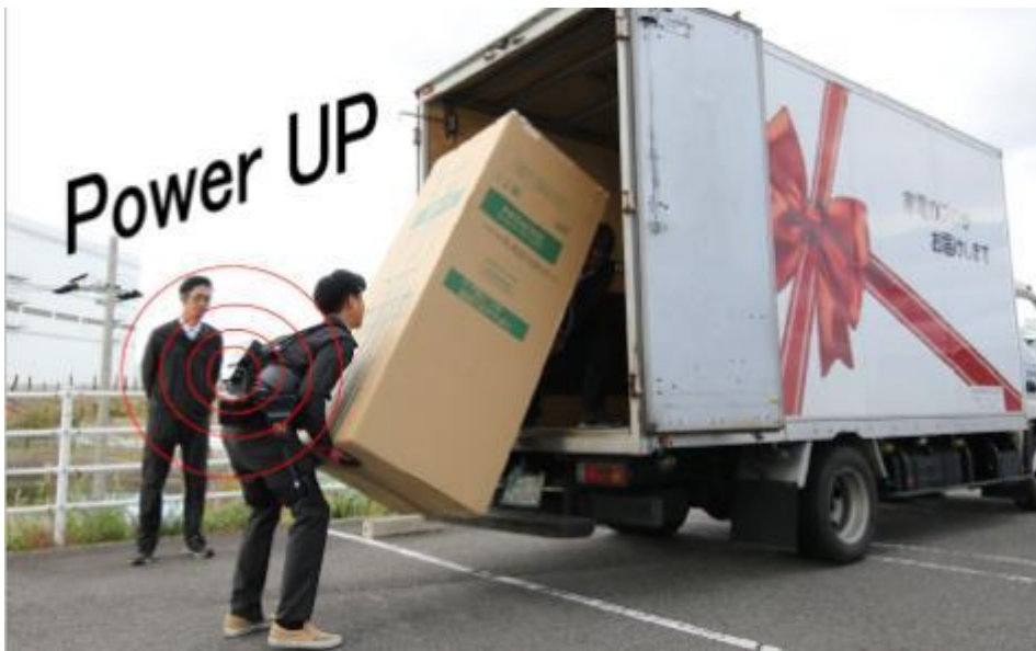
不安定な立方体も苦にならない